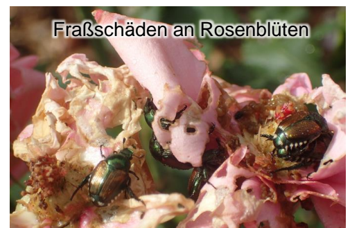
Fraßschäden an Rosenblüten

Die Käfer können täglich ca. 500 m weit fliegen. Pro Jahr wird eine natürliche Ausbreitung zwischen drei und 24 Kilometer für möglich gehalten. Mit Pflanzen und Grünschnitt kann