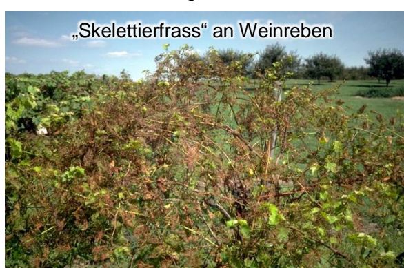
„Skelettierfrass“ an Weinreben